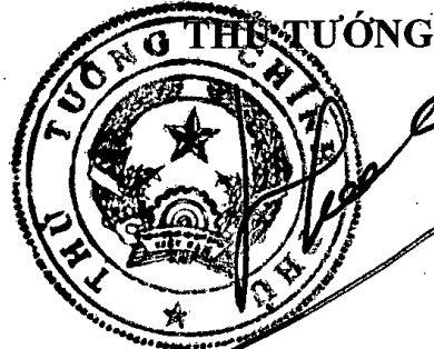
Nguyễn Xuân Phúc