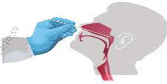
Hình 1: Lấy mẫu ngoáy dịch ty hầu